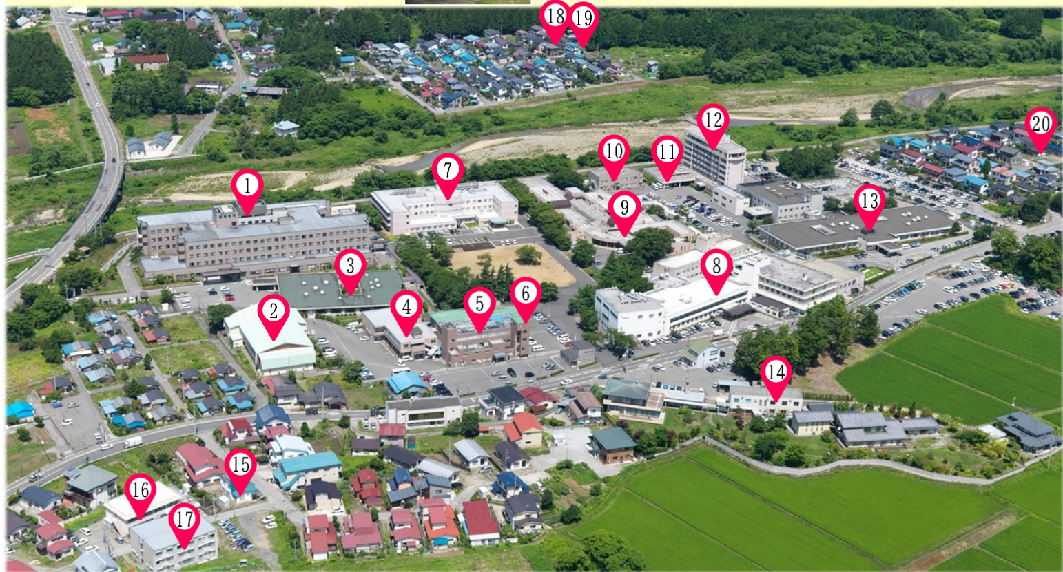
①飯塚病院 ②飯塚病院生活療法館 ③飯塚病院第3病棟 ④地域生活支援センター「ウィズピア」 ⑤昨雲会館 ⑥さくうん訪問看護ステーション・さくうん居宅介護支援事業所 ⑦鮮雲荘 ⑧有隣病院 ⑨北原荘 ⑩GHすこやか ⑪啓愛ヒルズ ⑫啓愛ヴィラ ⑬天心ケアハイツ ⑭七合図書館・飯塚健記念館 ⑮GHこぶし荘 ⑯ひめさゆり荘 ⑰女子寮 ⑱GHあさひ荘 ⑲GHふきのとう ⑳GHさつき荘 (⑦⑨⑩⑪⑫⑬は社会福祉法人天心会)