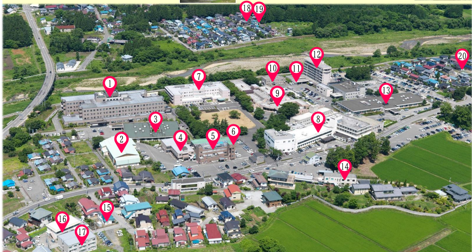
①飯塚病院 ②飯塚病院生活療法館 ③飯塚病院第3病棟 ④地域生活支援センター「ウィズピア」 ⑤昨雲会館 ⑥さくうん訪問看護ステーション・さくうん居宅介護支援事業所 ⑦鮮雲荘 ⑧有隣病院 ⑨北原荘 ⑩GHすこやか ⑪啓愛ヒルズ ⑫啓愛ヴィラ ⑬天心ケアハイツ ⑭七合図書館・飯塚健記念館 ⑮GHこぶし荘 ⑯ひめさゆり荘 ⑰女子寮 ⑱GHあさひ荘 ⑲GHふきのとう ⑳GHさつき荘 (⑦⑨⑩⑪⑫⑬は社会福祉法人天心会)